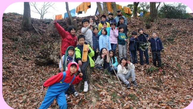
極寒でのテント泊も仲間と一緒に乗り越えられました!