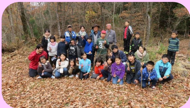
異学校や異学年、新しい友だちが増えました!