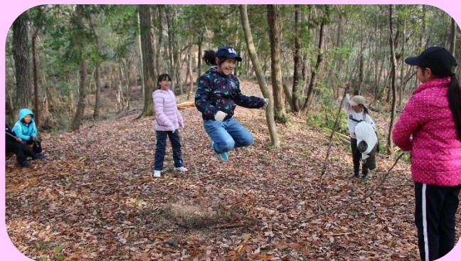
プログラムがないので、山でゆっくり遊べました!