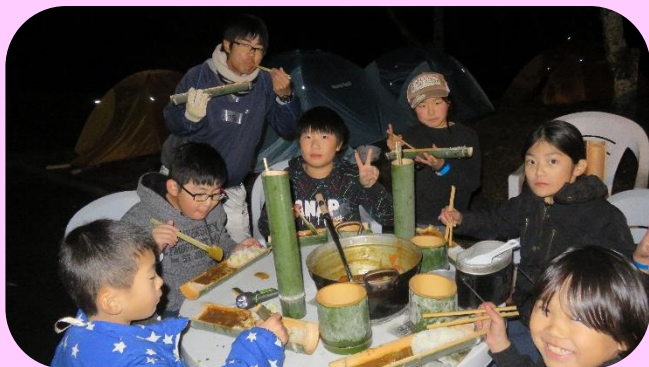
限られた食材で献立を考え、野外炊事に挑戦しました!